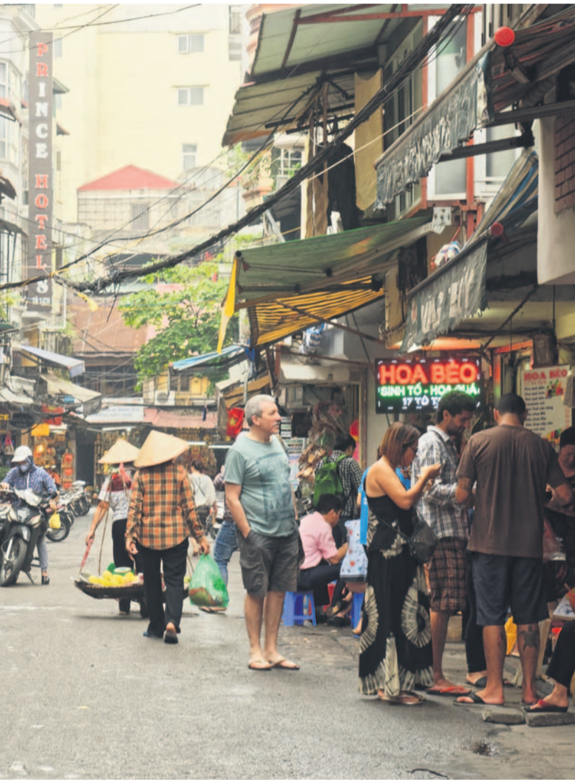
eder som Vietnam. Bildet er fra Hanoi.