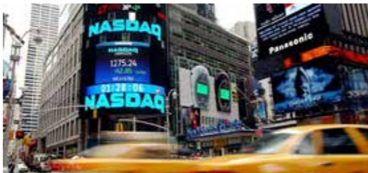
HØYT PRISET: Finansco har flyttet en del aksjeeksponering fra internasjonale markeder, som USA, til Oslo Børs.

– Av samme grunn har vi gradvis gått fra å foretrekke globale