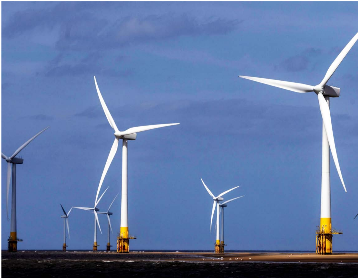
I VINDEN: Europas skyhøye elektrisitetspriser bidrar til å øke etterspørselen etter alternative energikilder.